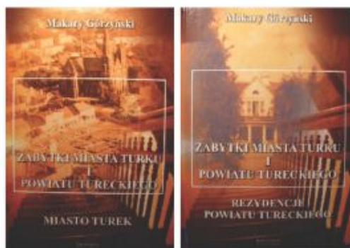
ZABYTKI MIASTA TURKU I POWIATU TURECKIEGO