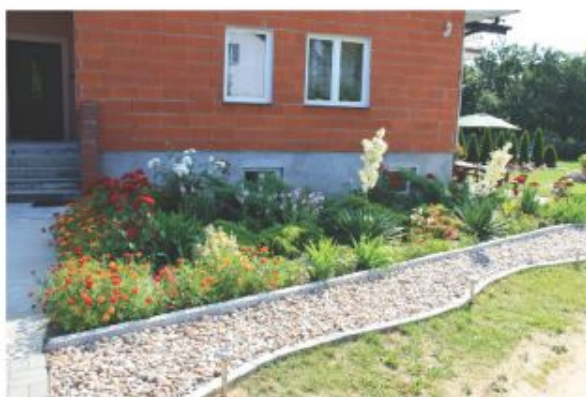
m-ce 2 Krystyna Ćwick - Chrząblice