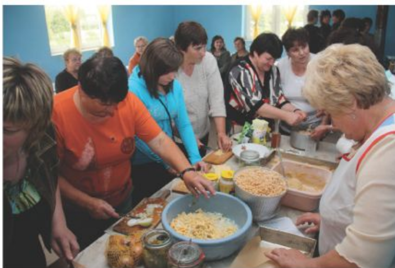
Miło popatrzeć na tak zintegrowaną społeczność lokalną i oby te działania i wspólna inicjatywa z każdym miesiącem rosły i owocowały.

Makrobiotyka jest sztuką pełnego, harmonijnego i zdrowego życia. "Makrobioi" znaczy po grecku "długo żyjący", a makrobiotyka to ktoś, kto z pomocą właściwej dla