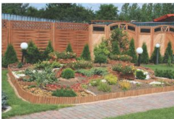
m-ce 3 Stanisław Pasturek - Kuźnica Janiszewska