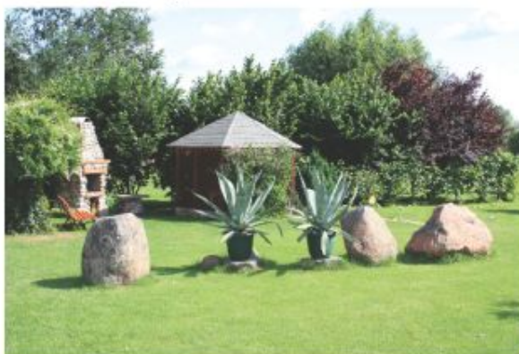
m-ce 2 Józef Pajor - Janiszew