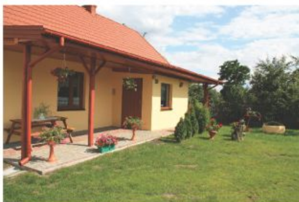
m-ce 3 Jolanta i Krzysztof Picewicz - Janów