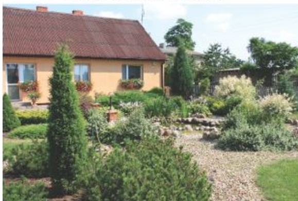
m-ce 1 Stanisław Frączak - Galew