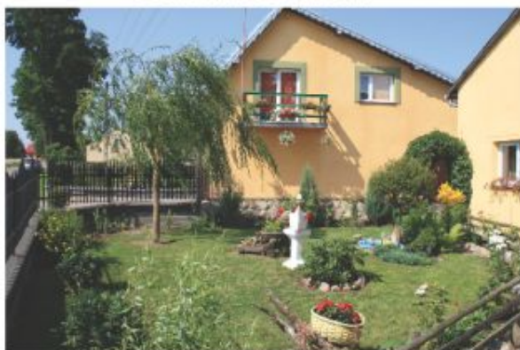
m-ce 1 Józef Świerblewski - Izabelin