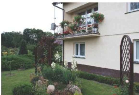
m-ce 3 Violetta Chamera - Brudzew