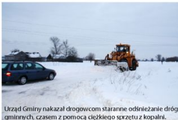
Urząd Gminy nakazał drogowcom staranne odśnieżanie dróg gminnych, czasem z pomocą ciężkiego sprzętu z kopalni.