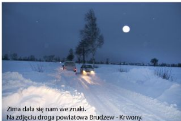
Zima dała się nam we znaki. Na zdjęciu droga powiatowa Brudzew - Krwony.

Wspólna realizacja projektu w partnerstwie to jego największa zaleta. Nie konkurencja - a efektywna współpraca pomiędzy samorządowcami, nauczycielami oraz rodzicami może w przyszłości przyczynić się do ułatwienia startu życiowego naszym dzieciom. Projekt ma na celu stworzenie im jak najlepszych warunków do zdobywania wykształcenia. Co ważne zapewnione będą również dowozy spoza miejscowości, w jakich znajdują się szkoły, a zajęcia na pewno będą bardzo atrakcyjne.