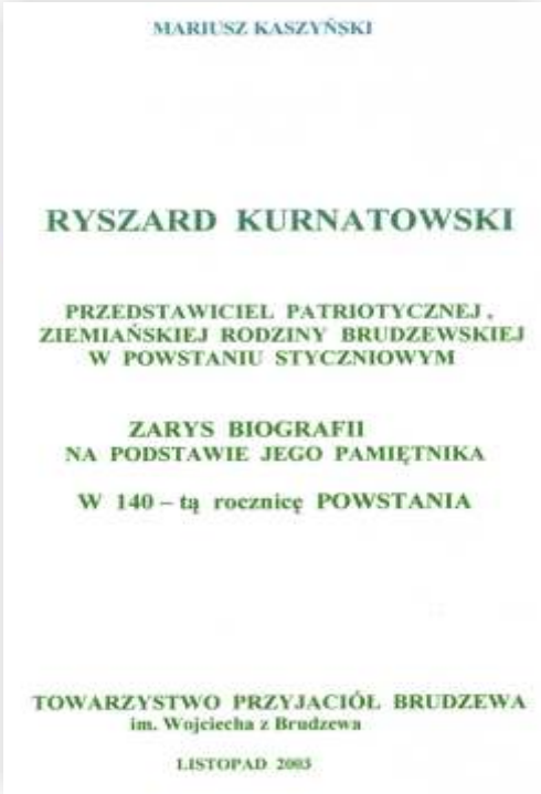
Pierwsza publikacja Towarzystwa-listopad 2003r.

Zrekonstruowany z inicjatywy Towarzystwa Przyjaciół Brudzewa grobowiec Rodziny Kurnatowskich na cmentarzu ewangelicko-augsburskim w Felicjanowie koło Władysławowa. Na miejscu stan pomnika przywrócili pracownicy gminy Władysławów.