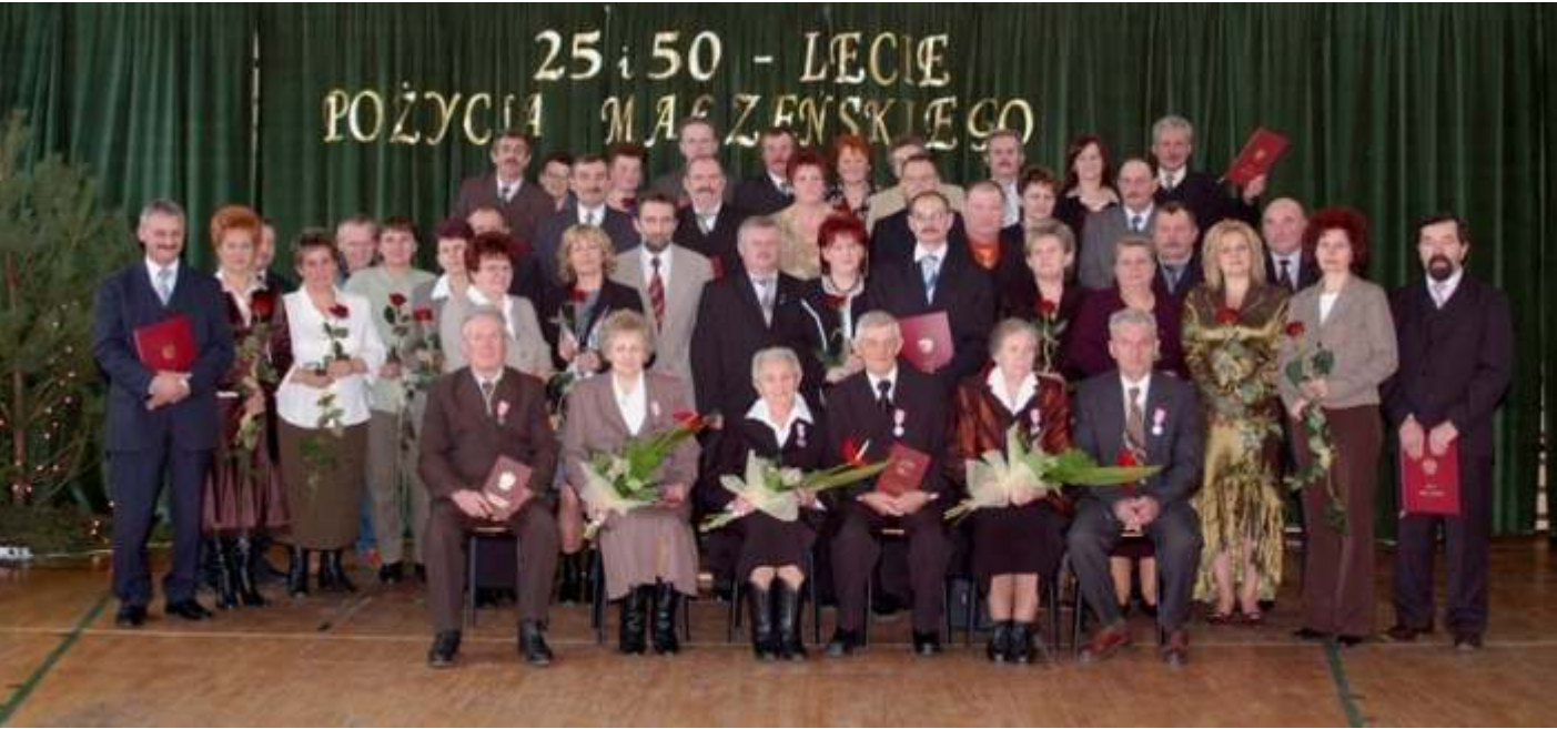
czytaj. str. 3