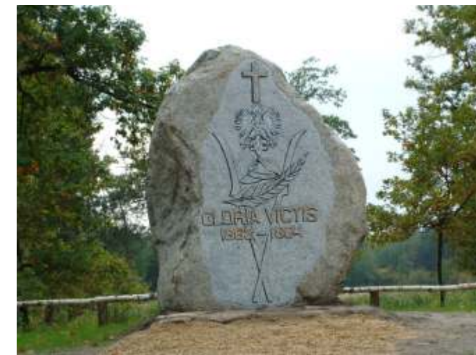
Gloria Victis- chwała zwyciężonym, pomnik ku czci powstańców styczniowych w lesie sacalskim

144 lata temu- 22 stycznia 1863 roku, rozpoczęło się powstanie styczniowe. Pielęgnowanie rocznic, dotyczących zdarzeń w historii Narodu jest cechą typowo polską i przyczynkiem do naszej narodowej dumy. Powstanie styczniowe było ostatnim zrywem niepodległościowym narodu polskiego w XIX wieku. Trwało od połowy stycznia 1863 do wiosny 1864 roku.