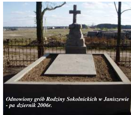
Odnowiony grób Rodziny Sokolnickich w Janiszewie - październik 2006r.

Ku rozważdce i pamięci- spór o odzyskanie zespołu dworsko-parkowego (marzec 2006r.) str. 4