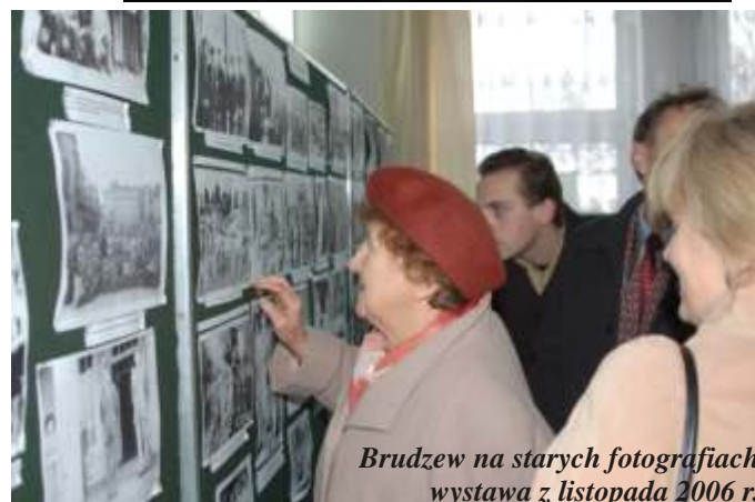
Brudzew na starych fotografiach wystawa z listopada 2006 r.